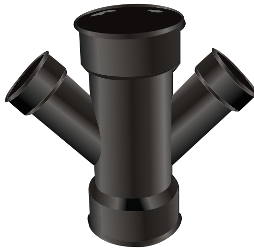
TEE WYE DOBLE